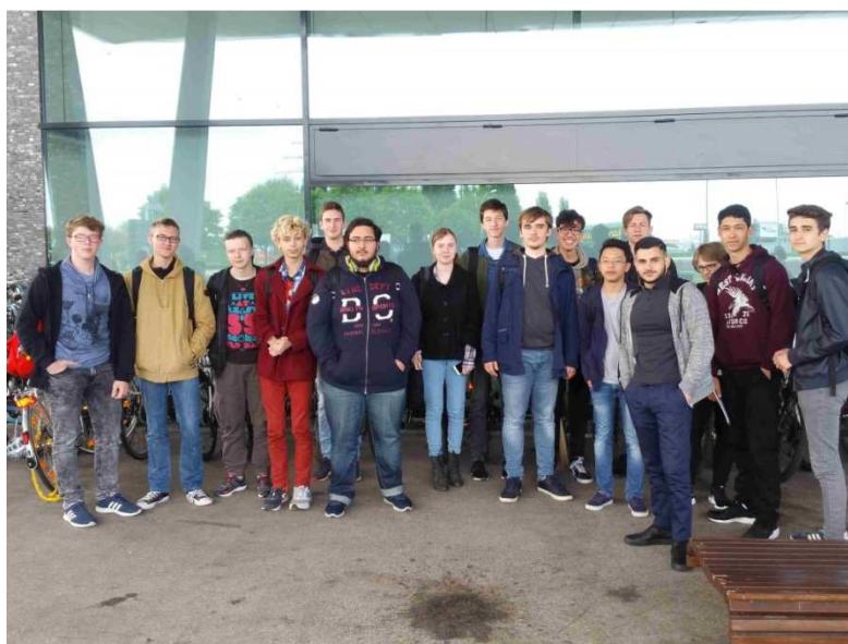
Groupe d'élèves de STI2D

Après une présentation effectuée en français et en allemand sur les enjeux de l'emploi et de la formation en Allemagne, les élèves ont pu parcourir en autonomie l'ensemble du salon.