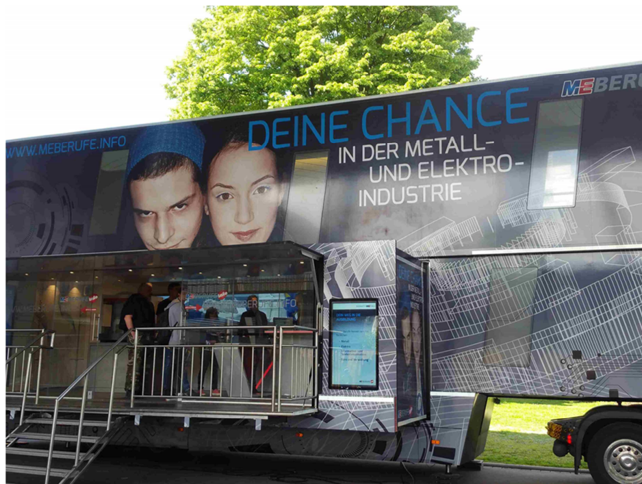
Présentation métiers et formations dans le domaine de la métallurgie et de l'électrotechnique