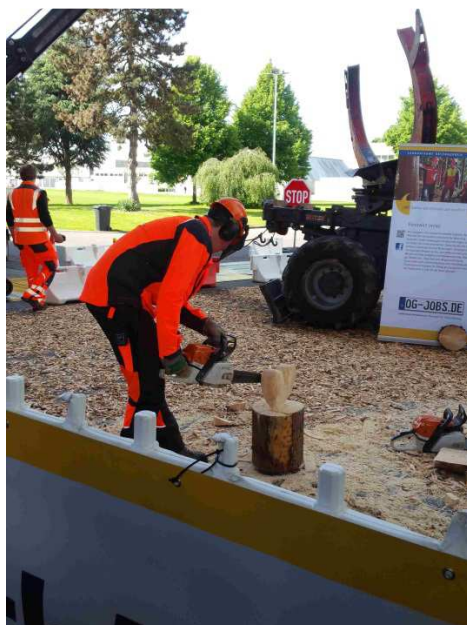
Présentation des métiers du bois

A l'issue de cette visite une réunion de synthèse a été organisée au lycée pour faire le point sur les avantages et inconvénients de cette journée ainsi que les pistes d'amélioration possibles pour une prochaine participation.