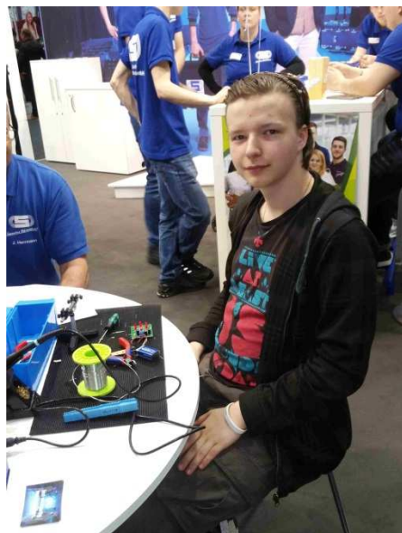
Atelier de réalisation de sous-ensembles électroniques